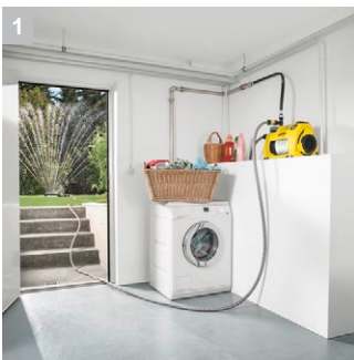
1 Простой в использовании дома и в саду.