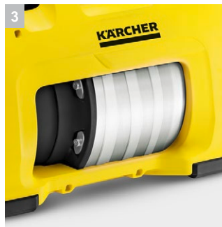
3 Многоступенчатый насос